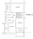
PIANO PRIMO H = 2.70