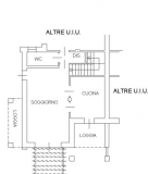
PIANO TERRA H = 2.70